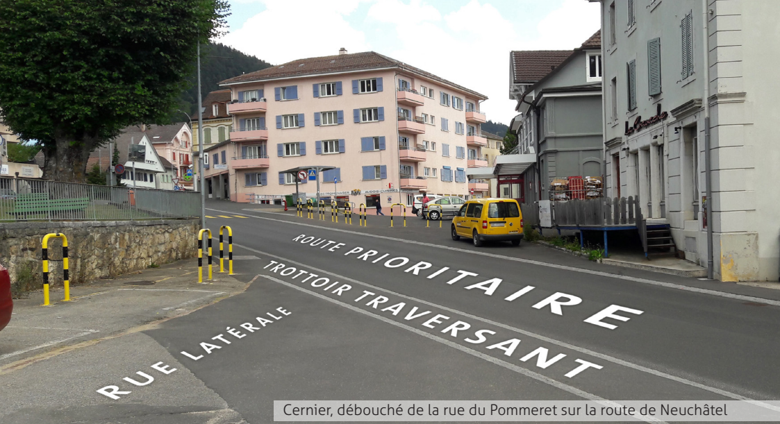
Cernier, débouché de la rue du Pommeret sur la route de Neuchâtel